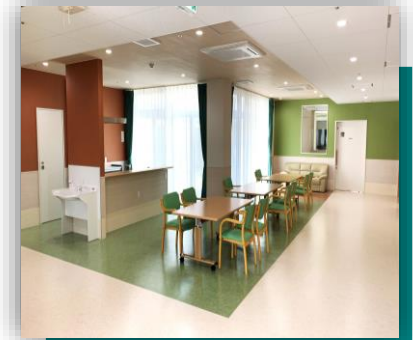
明るく開放的なフロア